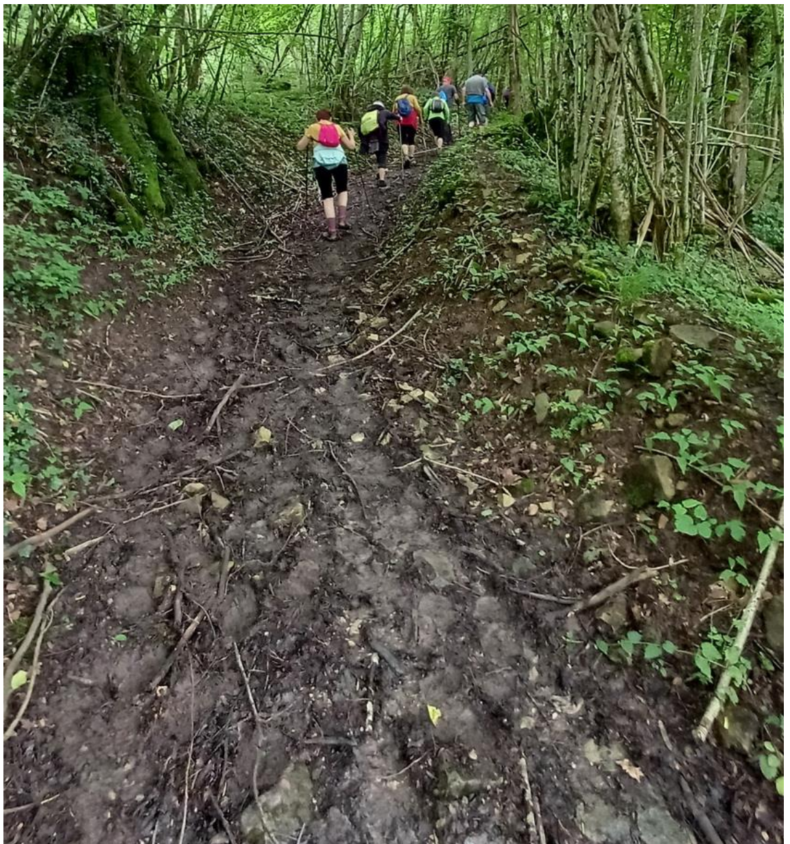
La gadoue, la gadoue !