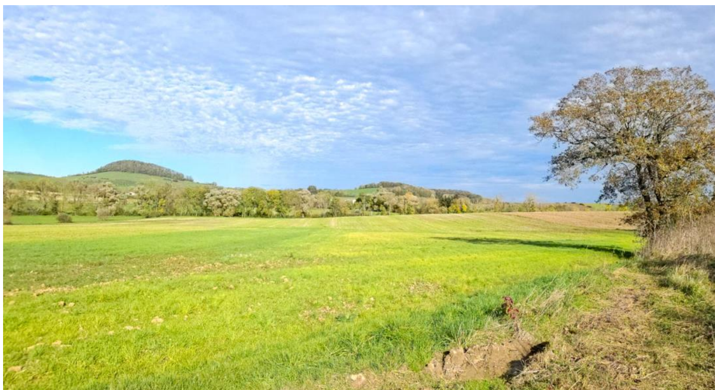
L'élevage d'alpagas à Courcelles