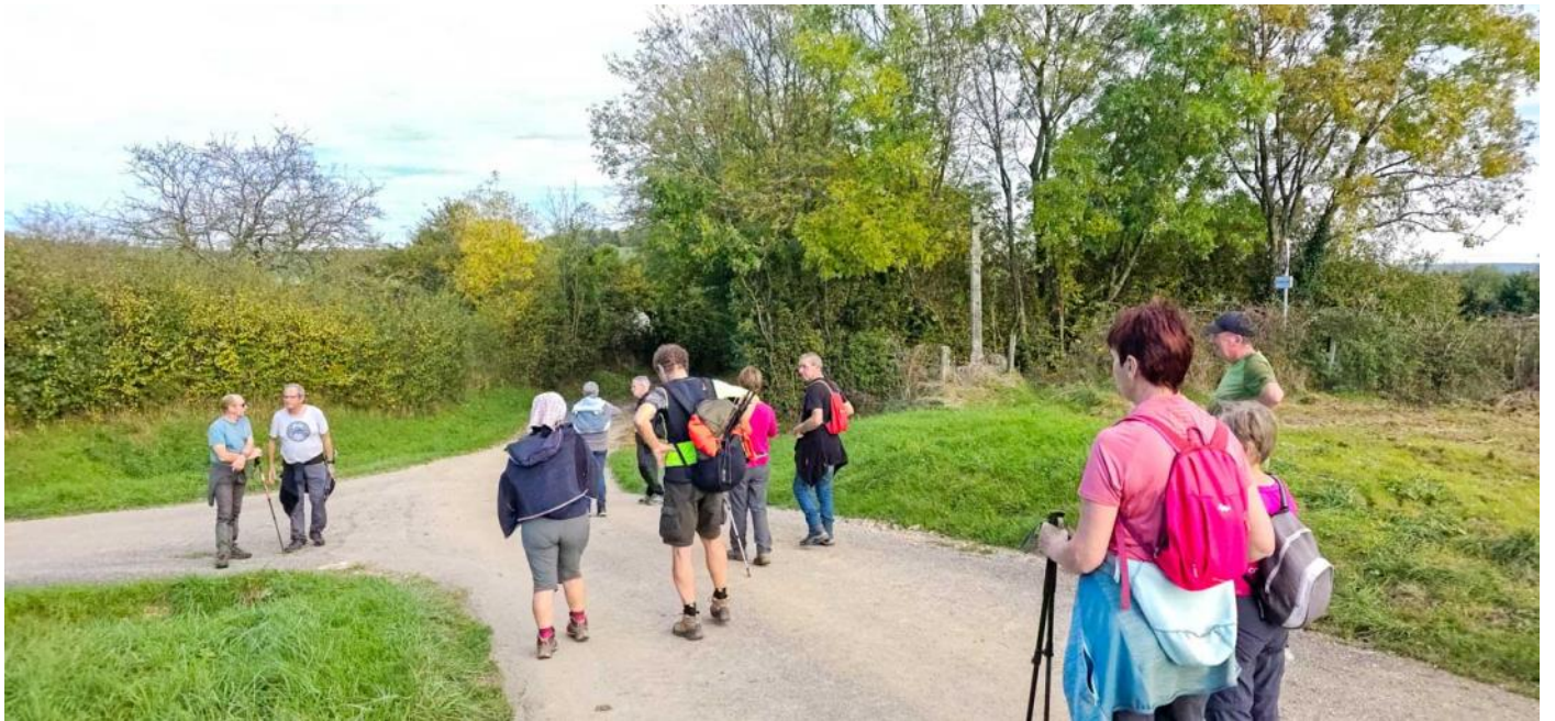
Le calvaire de Fraisne-en-Santois