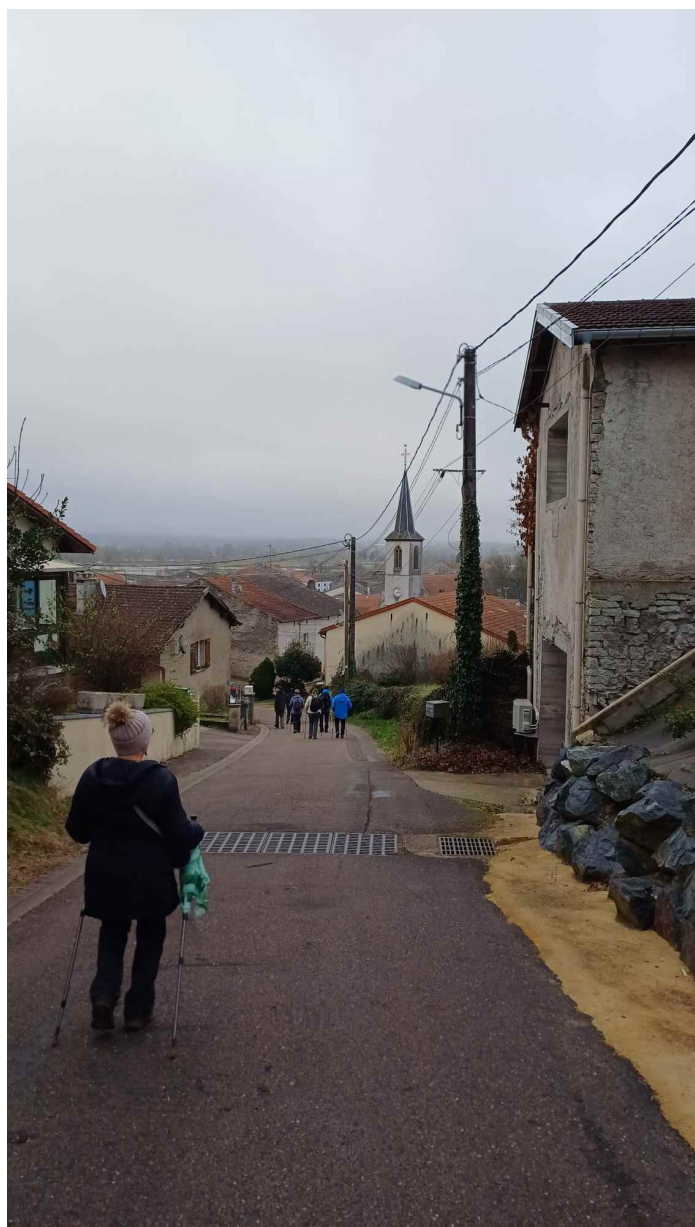
L'église St Léonard de Socourt du XiX ème