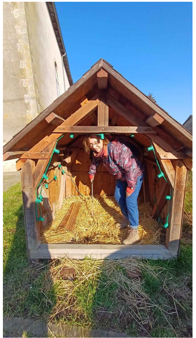
Église Saint-Georges du XIX de HOUSSEVILLE

Blason Housseville Écartelé : au premier et au quatrième de sinople à l'étoile d'or accompagnée de trois gerbes de blé du même, au deuxième d'azur aux deux colombes affrontées d'argent, membrées de gueules, posées sur un mont d'or et surmontées d'une étoile du même, au troisième de gueules au bièvre assis d'or, la queue d'argent.