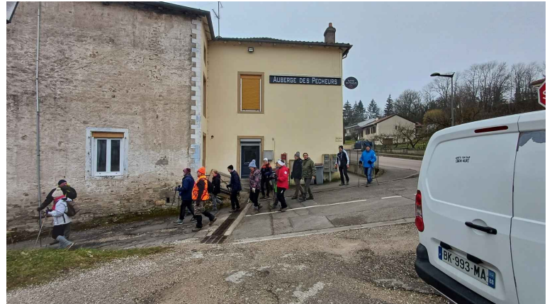
AUBERGE DES PÊCHEURS