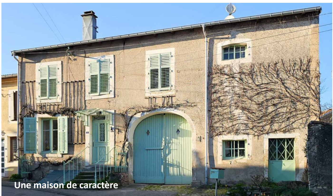
Une maison de caractère