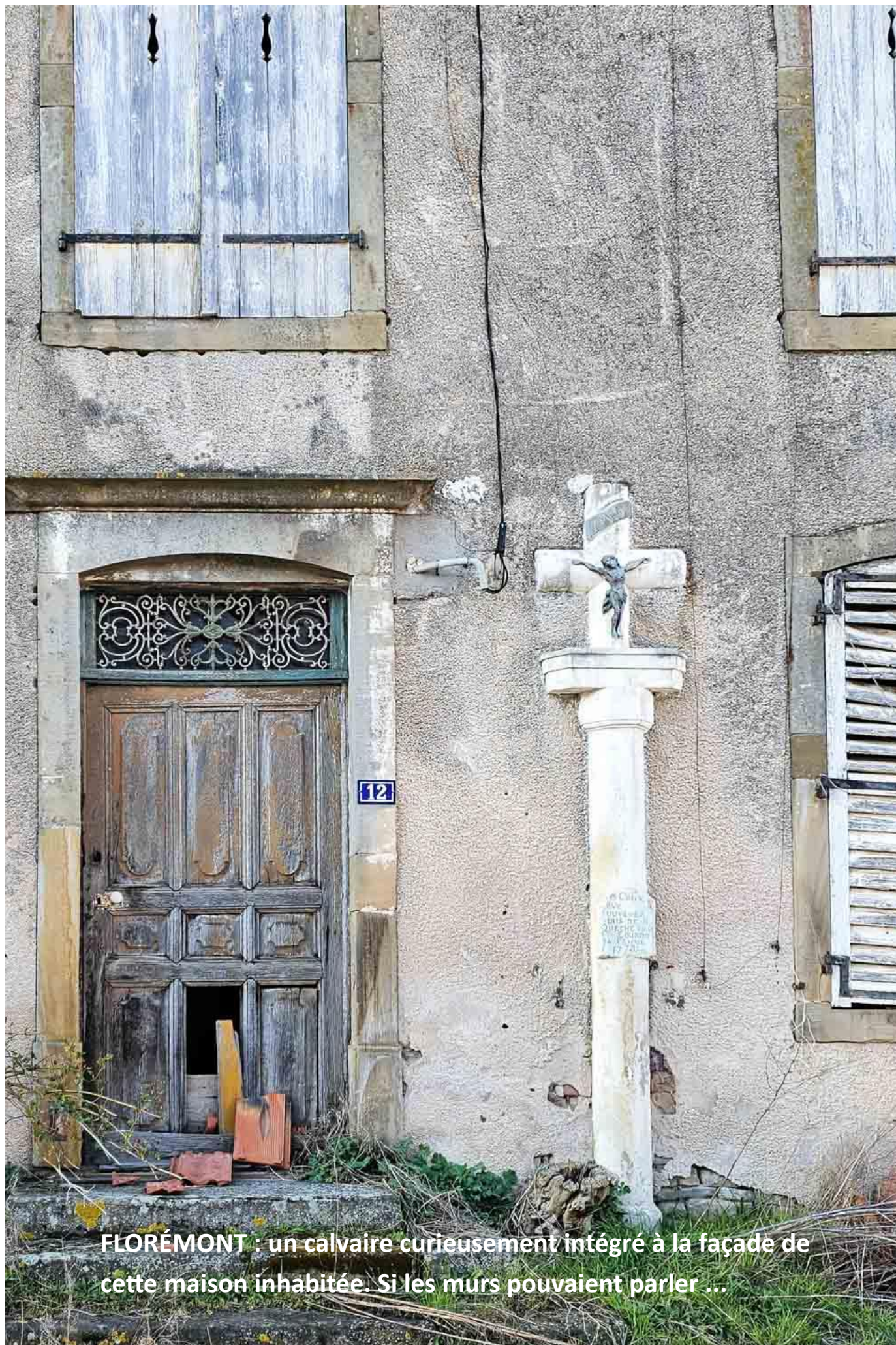
FLOREMONT : un calvaire curieusement intégré à la façade de cette maison inhabitée. Si les murs pouvaient parler ...