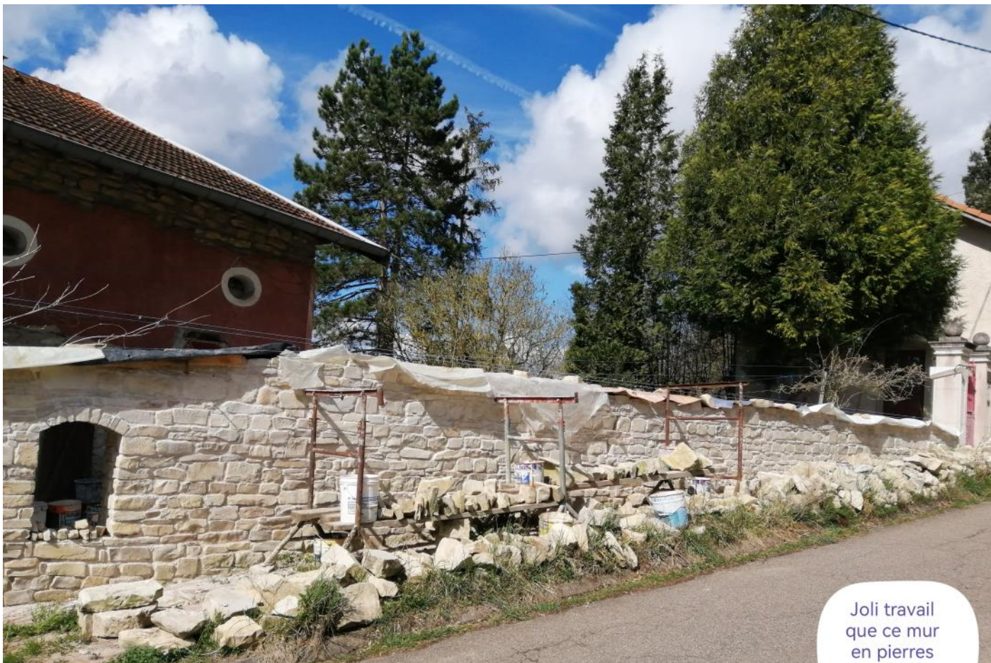
Joli travail que ce mur en pierres sèches !