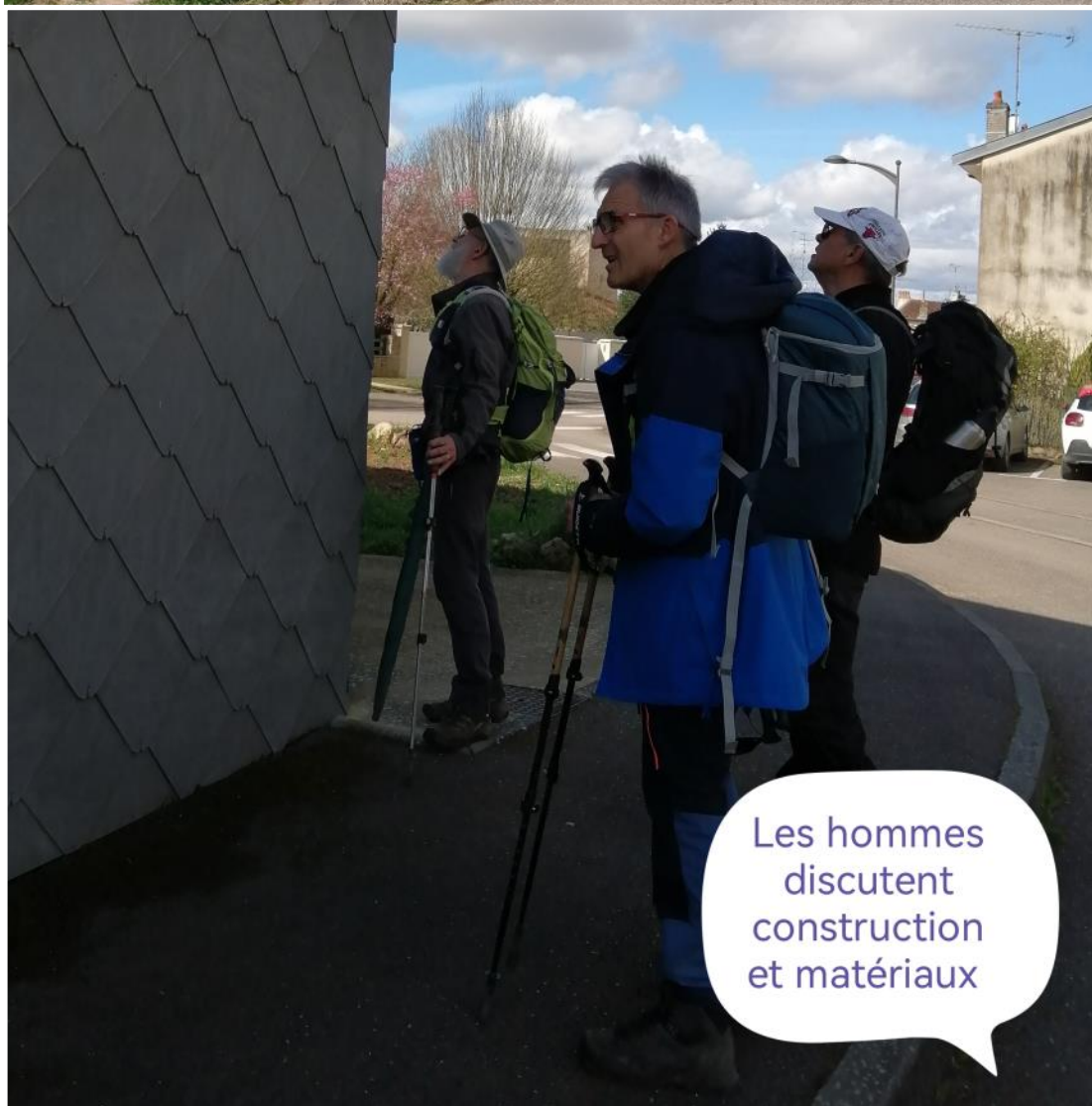
Les hommes discutent construction et matériaux