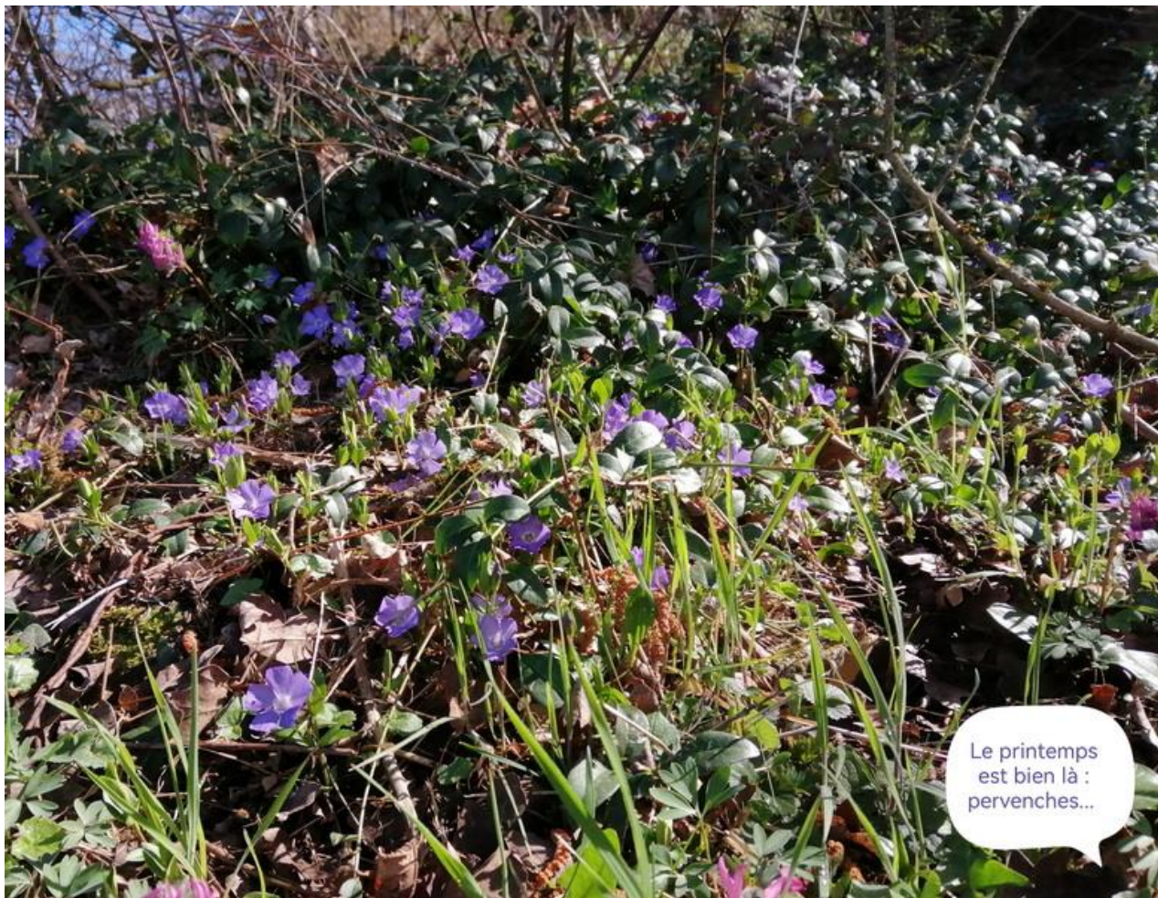
Le printemps est bien là : pervenches...