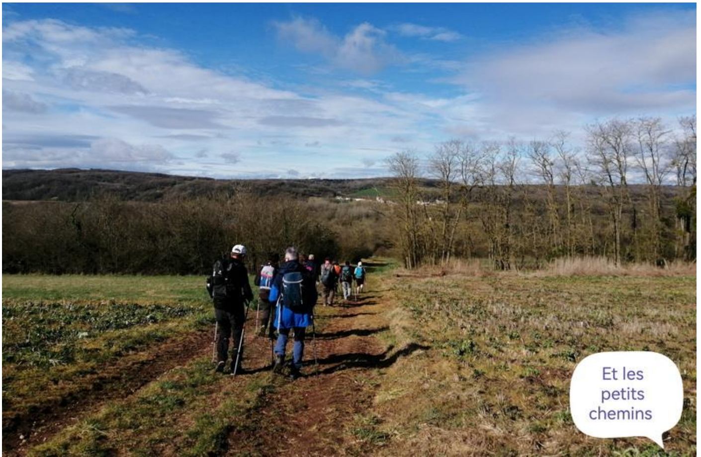
Et les petits chemins