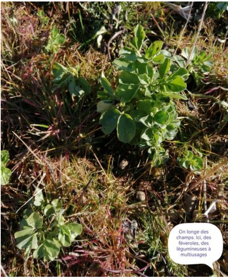
On longe des champs. Ici, des féveroles, des légumineuses à multiusages