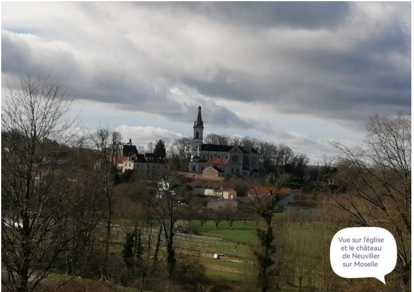
Vue sur l'église et le château de Neuviller sur Moselle