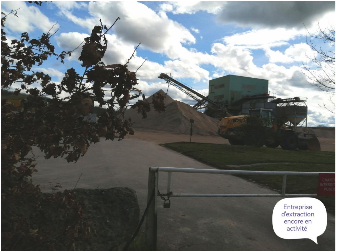
Entreprise d'extraction encore en activité