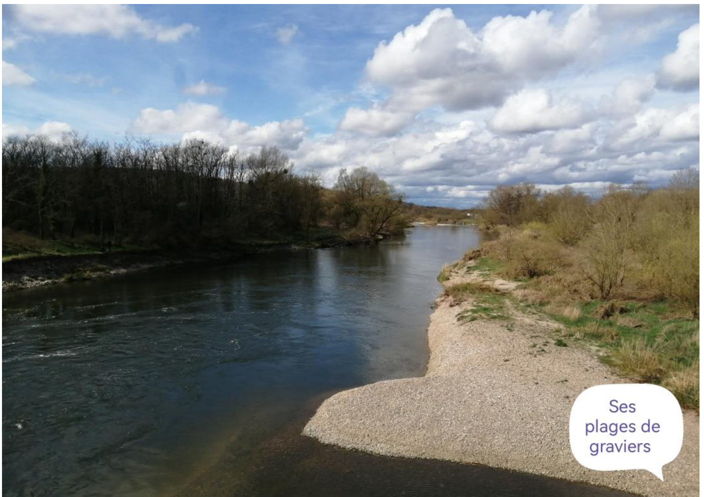
Ses plages de graviers