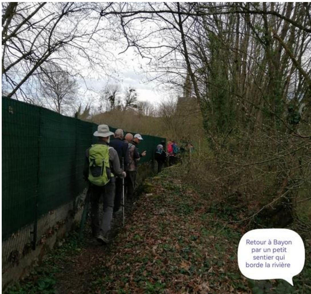
Retour à Bayon par un petit sentier qui borde la rivière