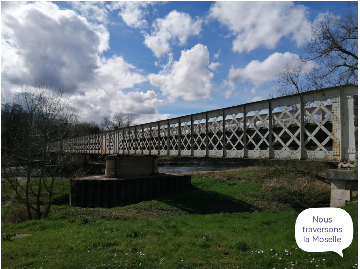
Nous traversons la Moselle