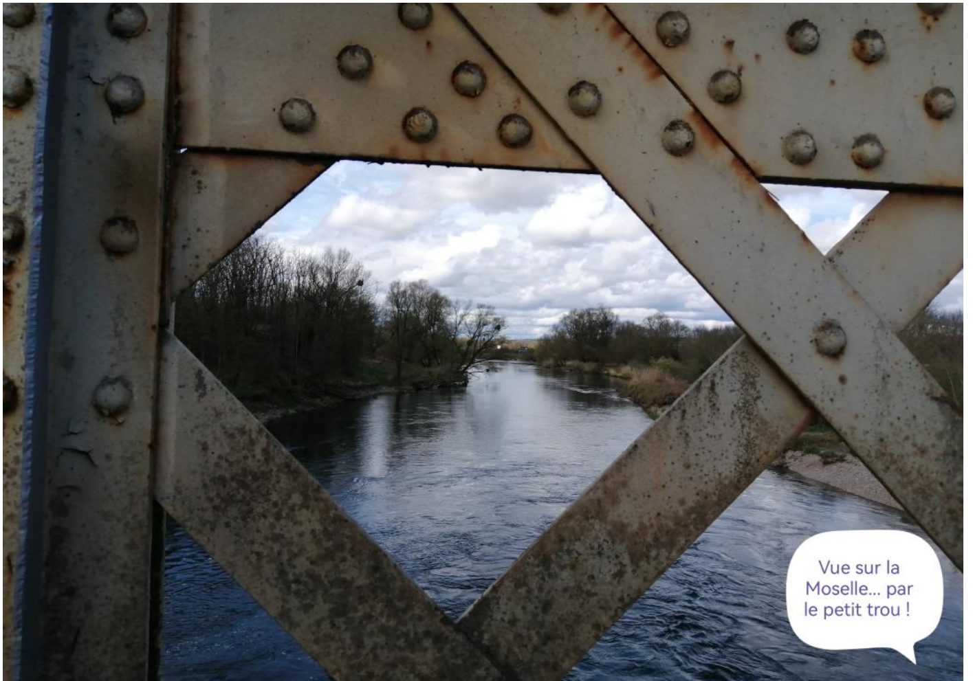
Vue sur la Moselle... par le petit trou !